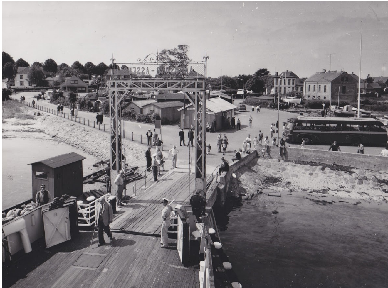
Aarøsund Havn set fra færgen 1960-70.