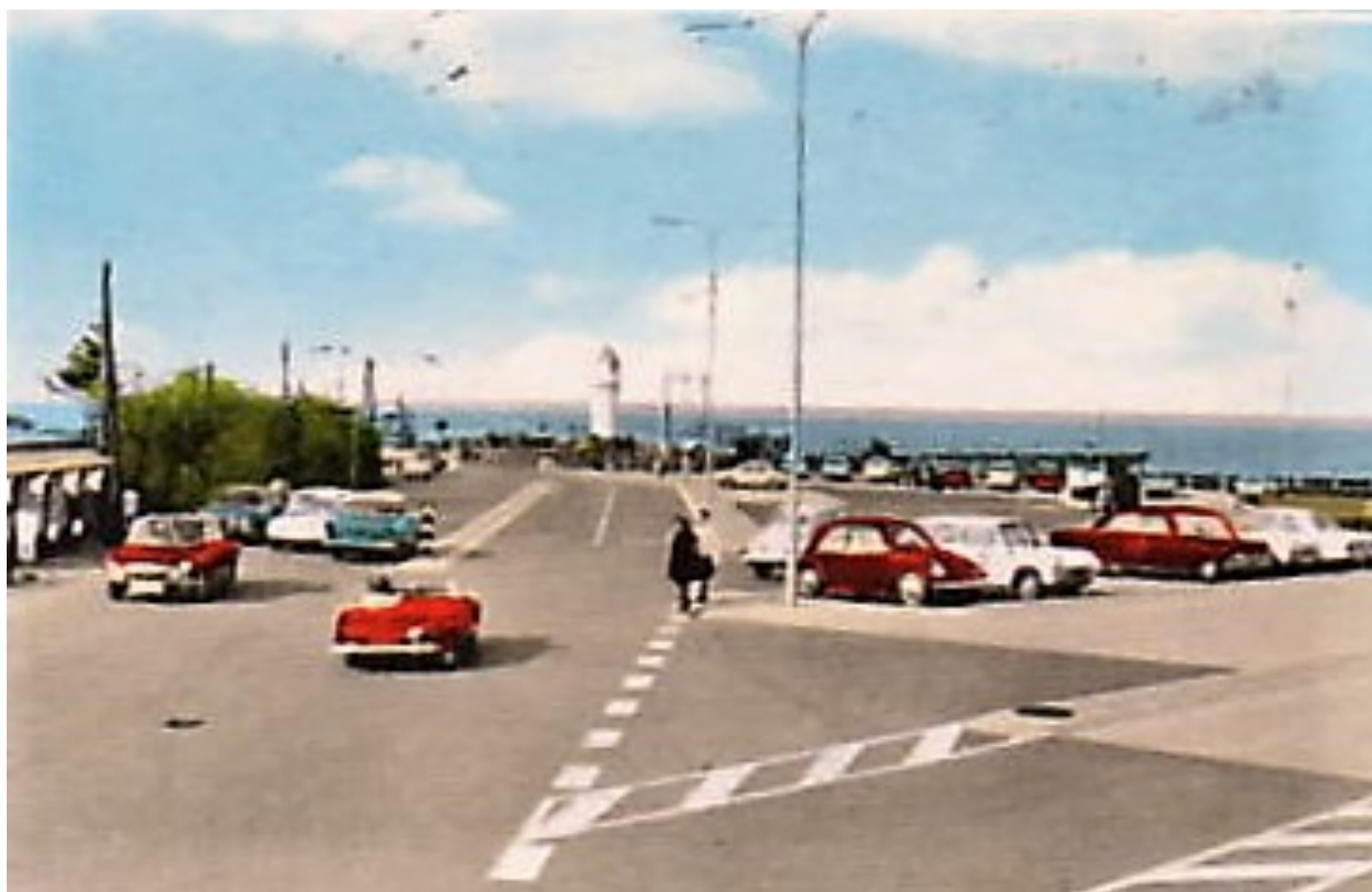
Udsnit af gammelt postkort fra 1978