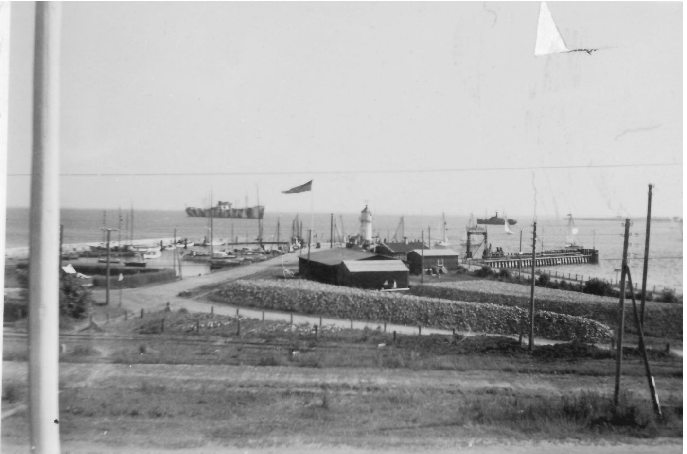
Aarø Sund havn fra 40'erne.