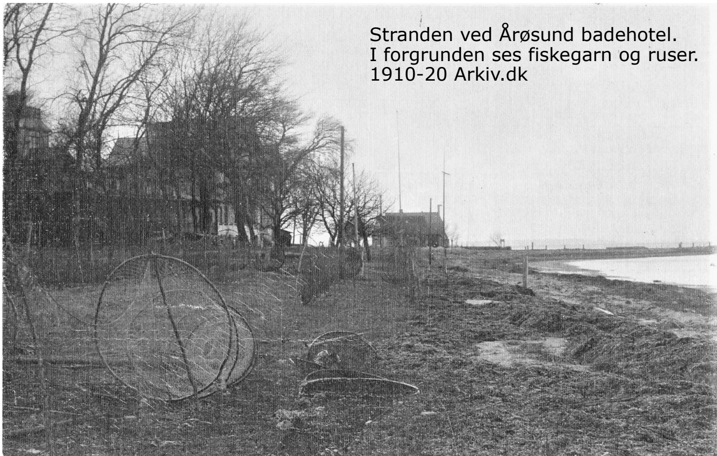
Stranden ved Årøsund badehotel. I forgrunden ses fiskegarn og ruser. 1910-20