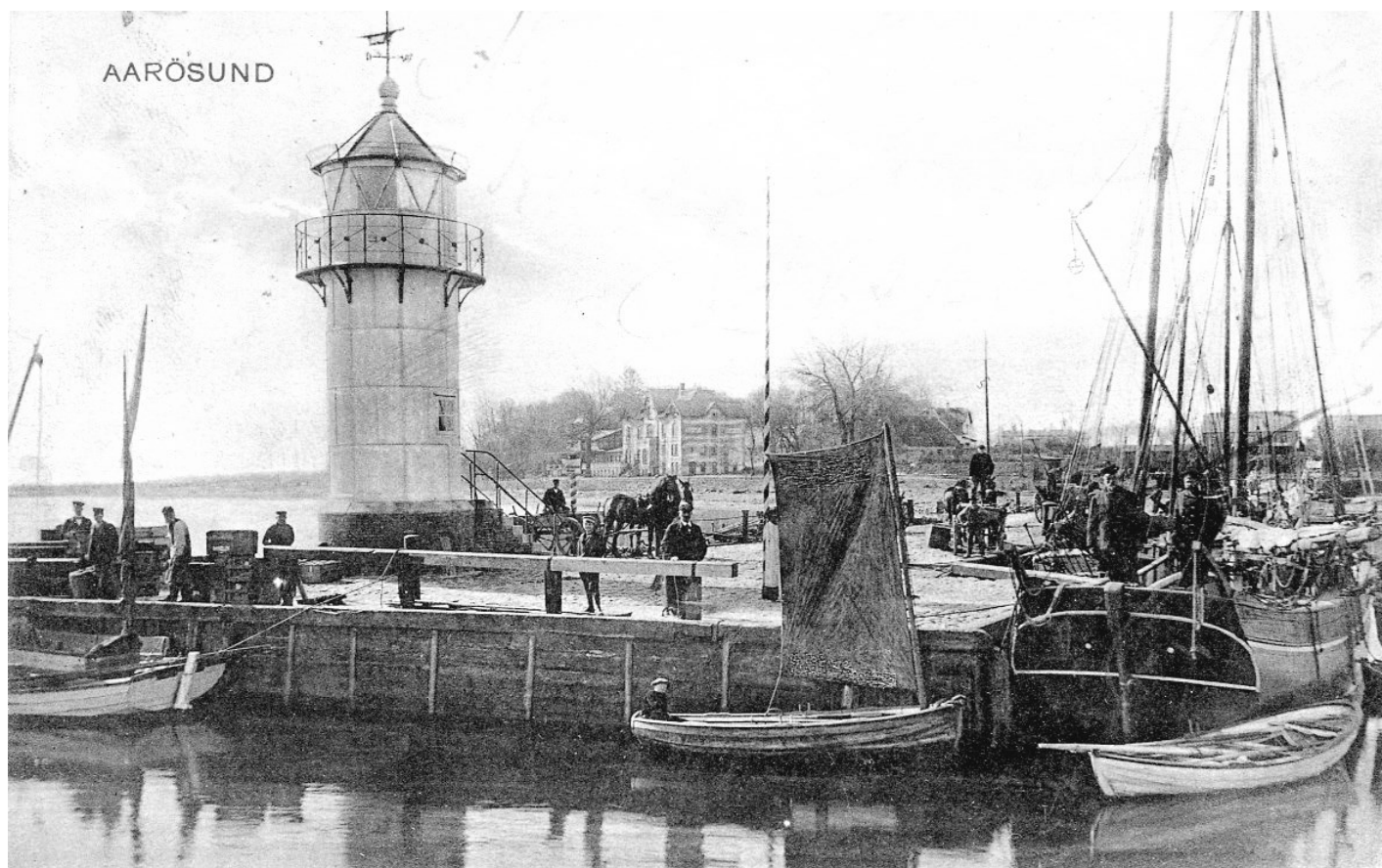
Fyret Aarøsund. Foto: Wilhelm Schützsack – Periode efter 1905 før 1920. Masser af liv ved havnen.