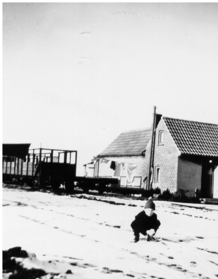
Togvogne til roer til færgen 1950