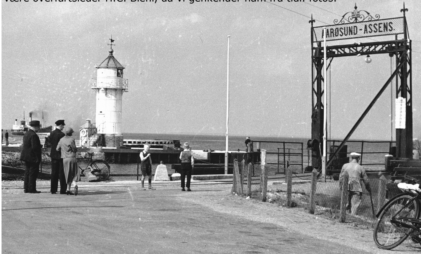
Foto det kgl. Bib. 1938. Venter på færgen. Manden med den hvide kasket kunne være overfartsleder H.C. Biehl, da vi genkender ham fra tidl. fotos.