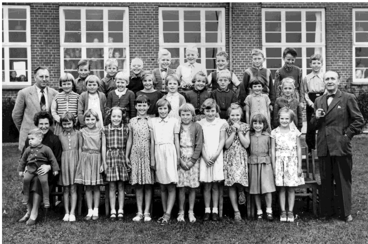
Gensyn Hajstrup skole 1955