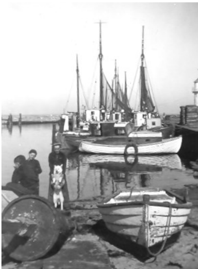
Årøsund beddingsliv 1950