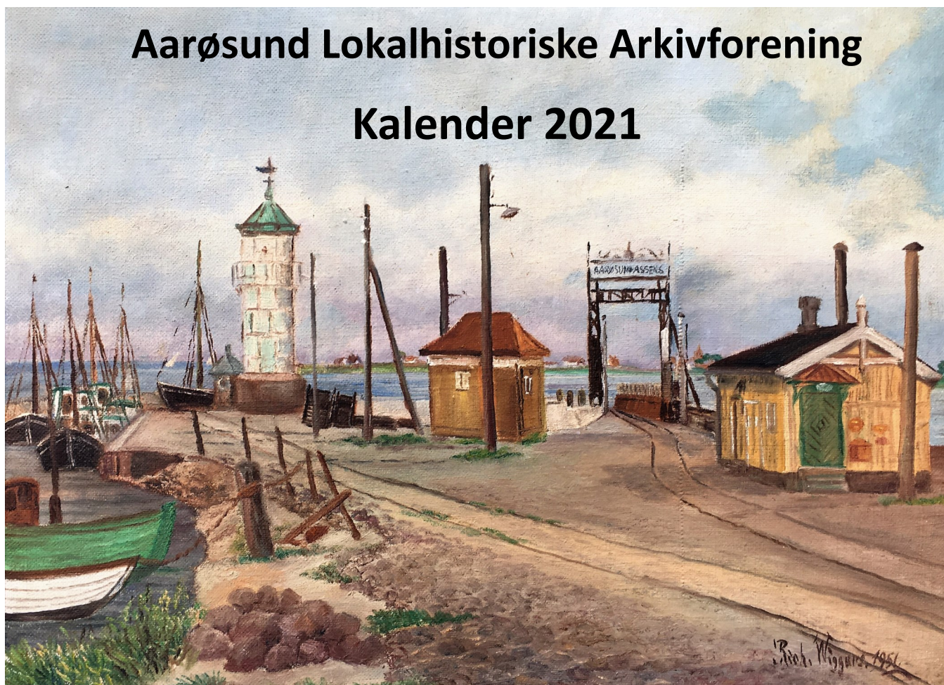
Maleri af Rich. Wiggers 1951 Aarøsund Havn. Privateje