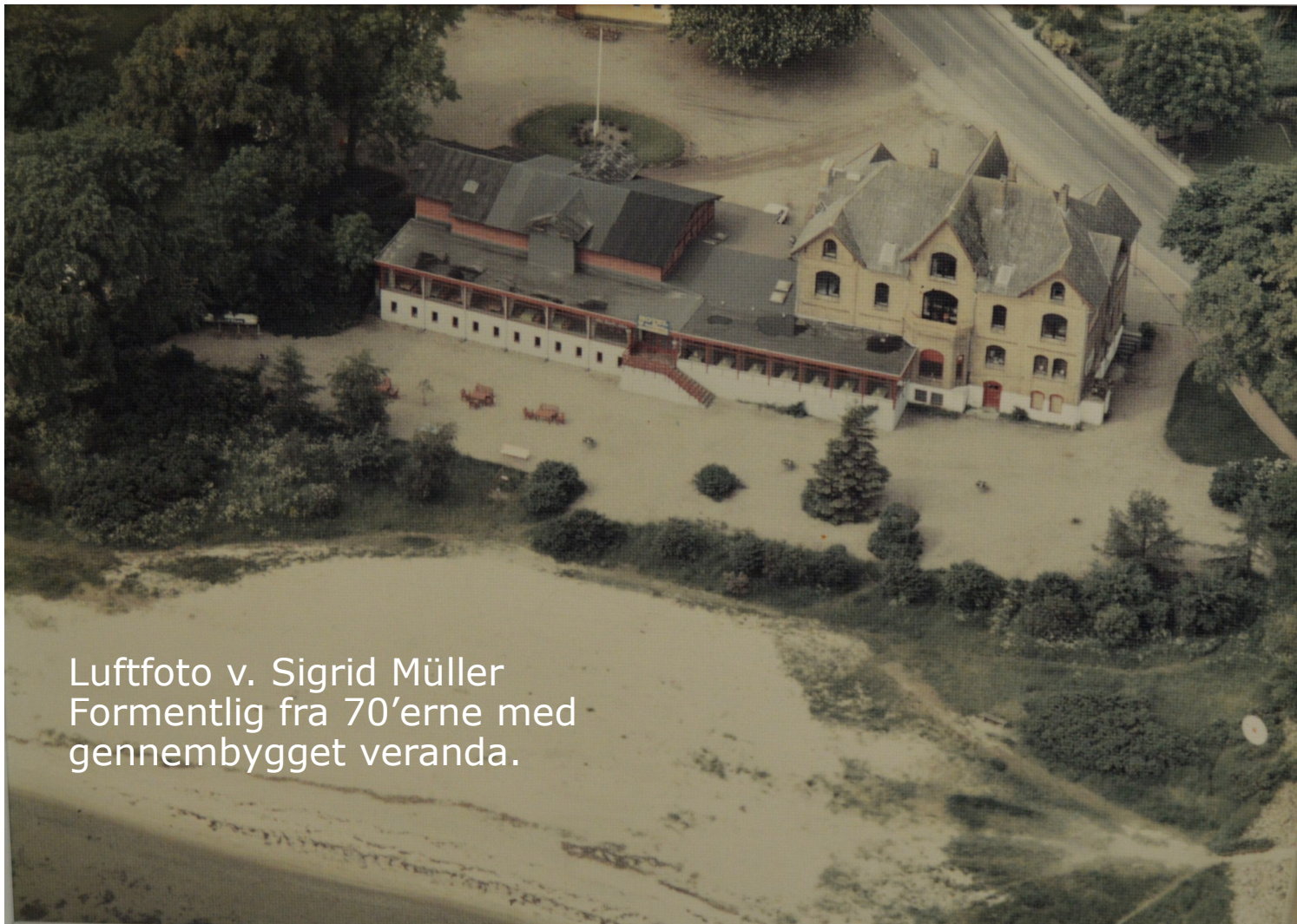
Formentlig fra 70'erne med gennembygget veranda.