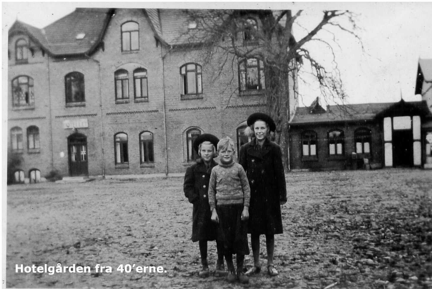
Hotelgården fra 40'erne.