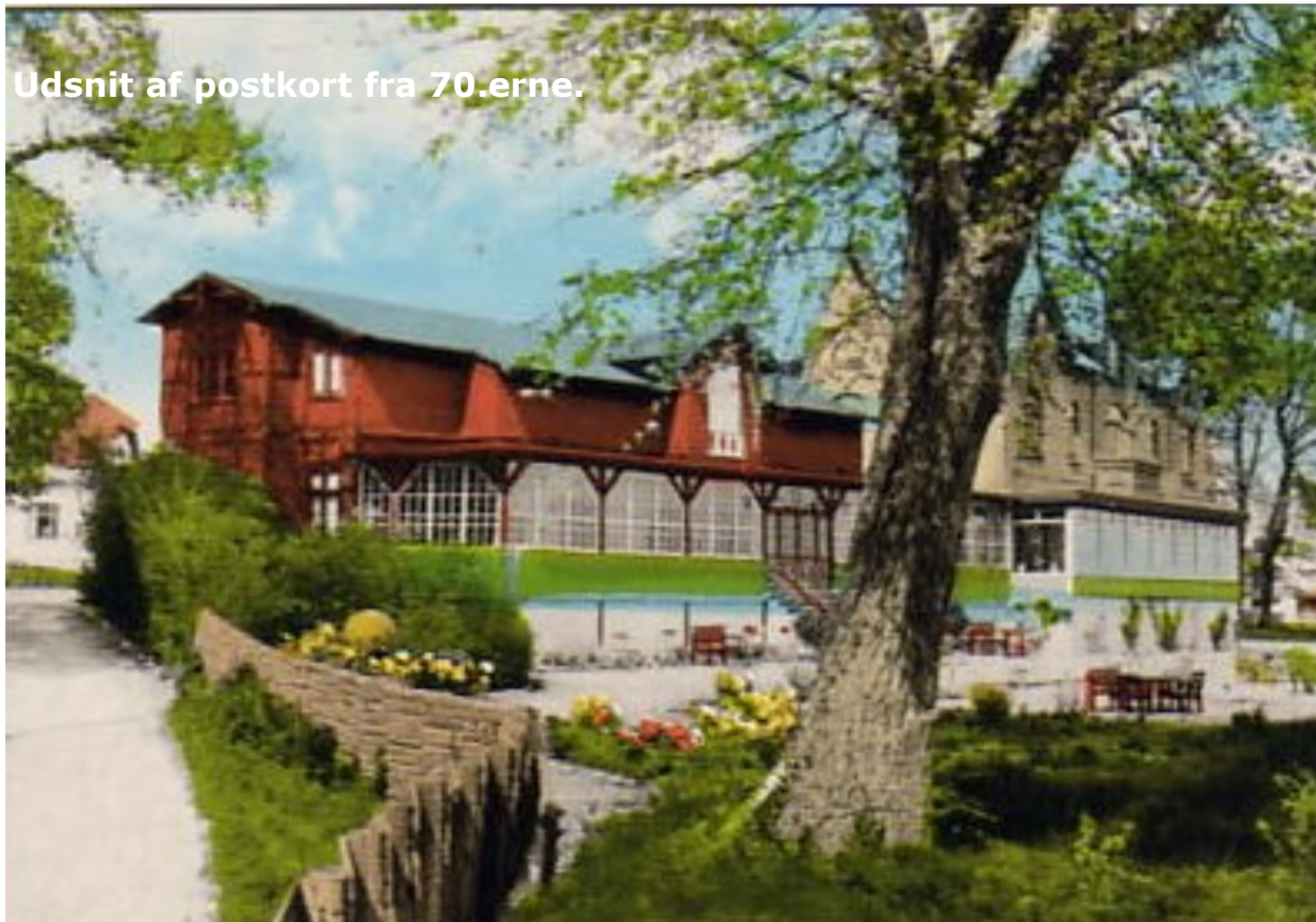
Udsnit af postkort fra 70'erne.