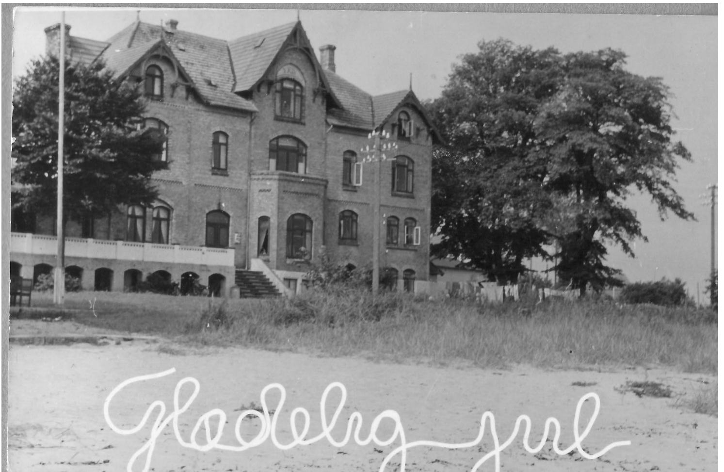
Julekort - 50'erne.