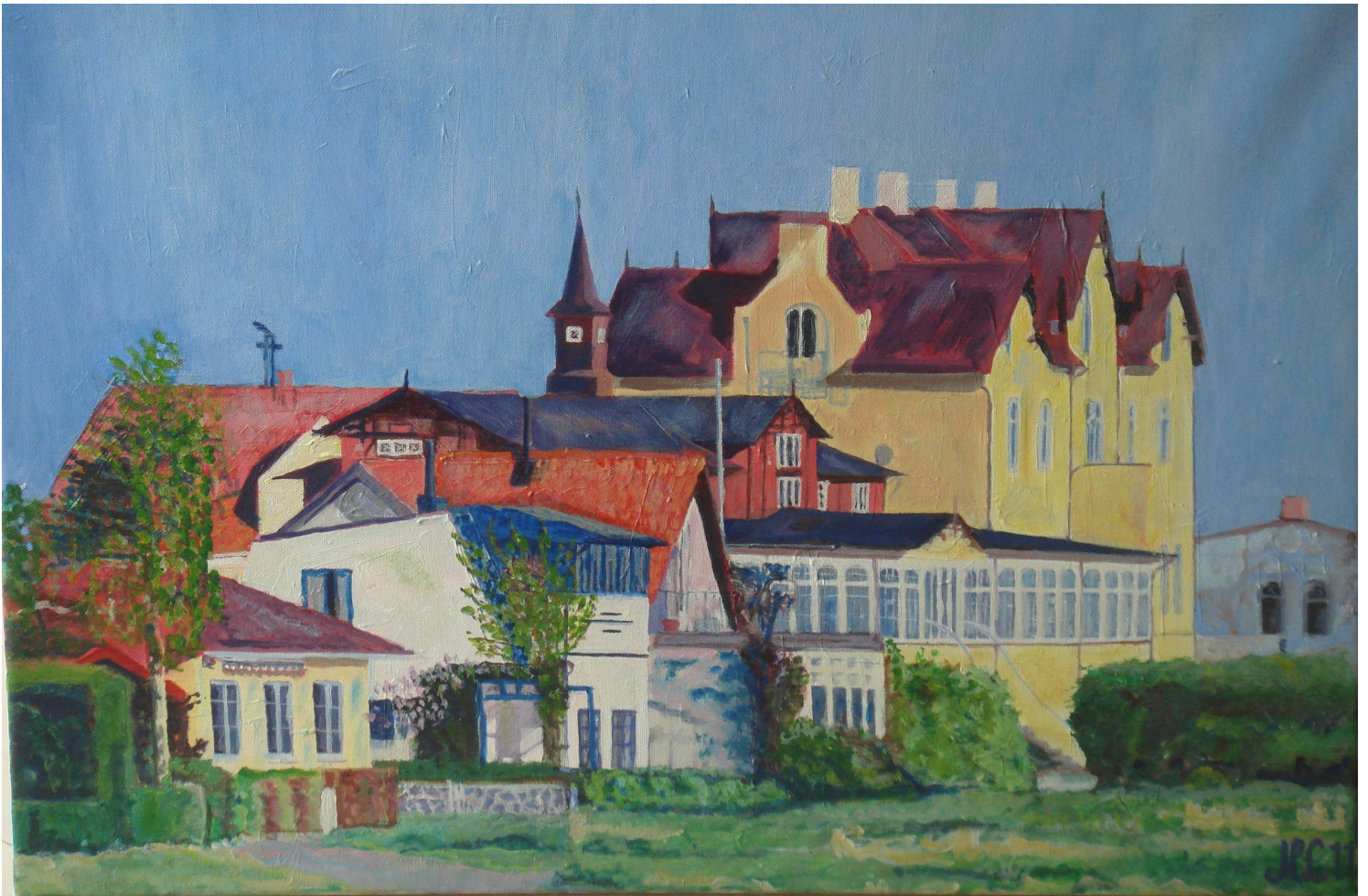
Aarøsund Lokalhistoriske Arkivforening – Kalender 2014