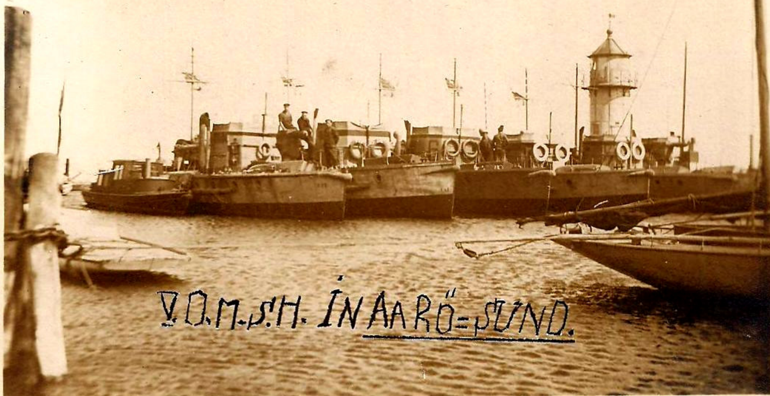
Aarøsund havn 1919. En tysk soldat har fotograferet 5 tyske minesuchboote, som fjernede miner efter krigen 14-18.