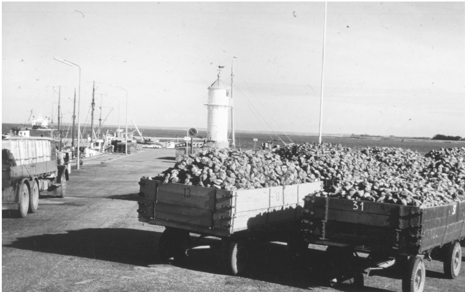
Roevognene står opmarcheret, klar til at blive trukket ombord og sejlet til Assens Sukkerfabrik. Bag molen ses færgen på vej i havn. Billedet fra først i 60'erne.