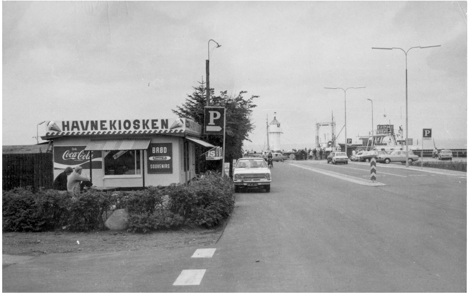
Aarøsund-Assens Færgelejet. Aarøfærgen ligger i færgelejet.. Sommerdage mødtes man ofte ved færgeankomst og –afgang. Der udveksledes nyheder og der blev købt is i kiosken.