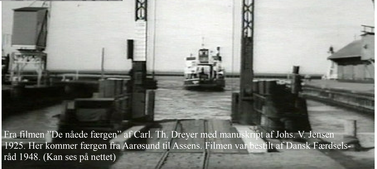
Fra filmen "De nåede færgen" af Carl. Th. Dreyer med manuskript af Johs. V. Jensen 1925. Her kommer færgen fra Aarøsund til Assens. Filmen var bestilt af Dansk Færdselsråd 1948. (Kan ses på nettet)