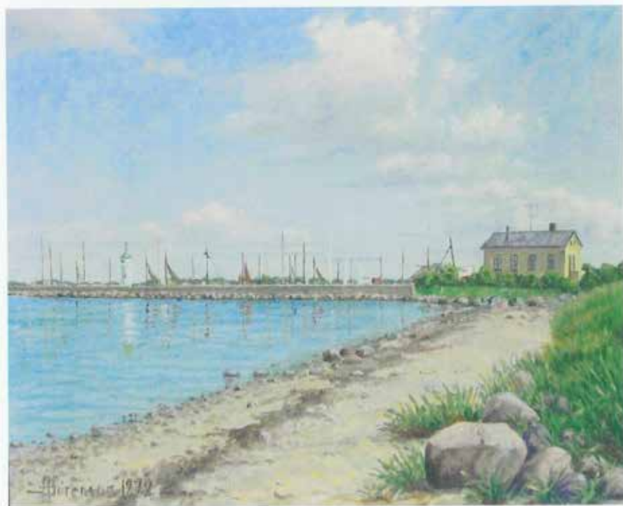
Maleri, skænket foreningen af Inger Petersen. Malet af A. Sørensen i 1972.