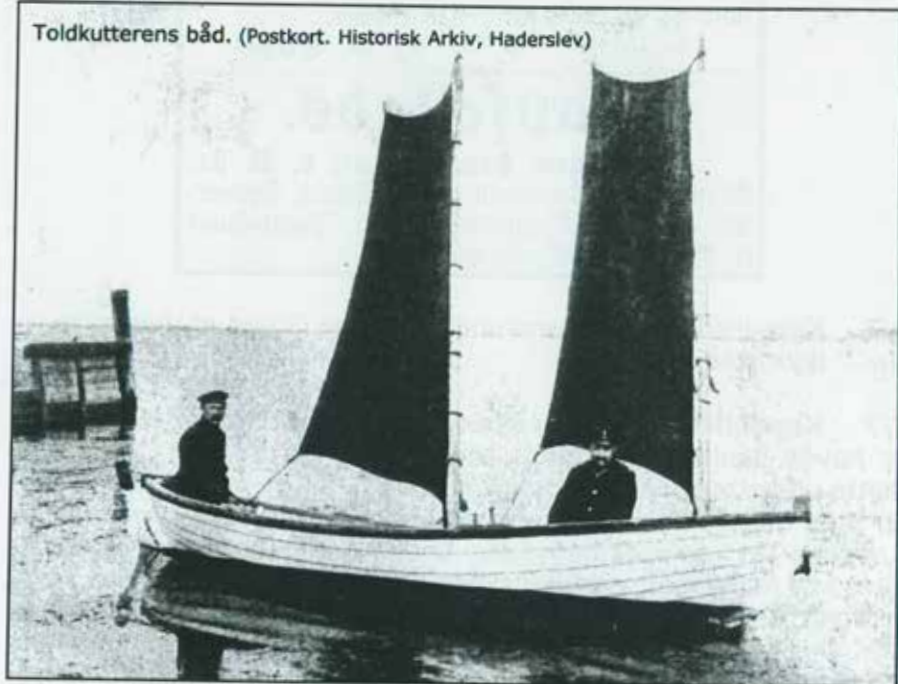
Toldkutterens båd.