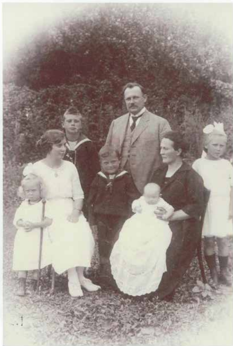
Barnedåb i Aarøsund i 1922.