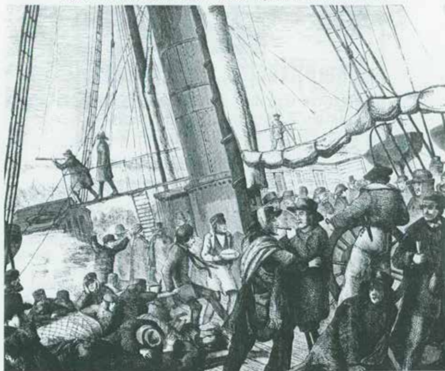
(Træsnit af Vilm. Rosenstand. Kilde: "Planmæssig ankomst".)

Dæksliv ombord på "Hekla" under rejsen til London i 1862.