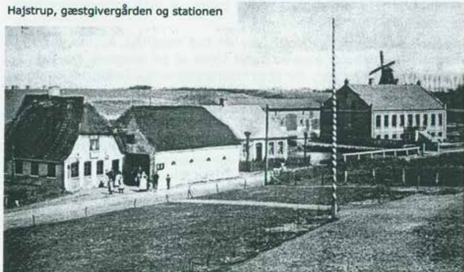
Hajstrup, gæstgivergården og stationen