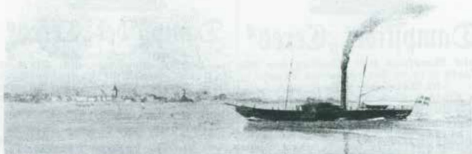
Maleri af C. Olsen. Handels- og Søfartsmuseet på Kronborg (Kilde: Danske Dampskibe indtil 1870 II)

Hjuldampskibet "Lille-Belt" udfør Assens. 1856 omdøbt "Ceres".